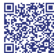
Aplikace pro Android

V přechodném období očekáváme na pobočkách fronty a přetížené telefonní linky. Pokud nebudete mít možnost nebo z nějakého důvodu nebudete chtít využít online podání žádosti o superdávku, můžete případně využít tzv. asistované podání na našich pobočkách.